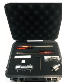
Super Dumbbell Stanzmesserset