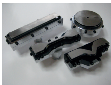
Super Dumbbell Stanzmesser